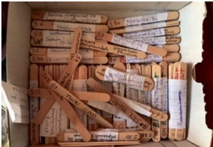
Ijscostokjes werden beschreven met naam, bestemming en adres.

“Woensdag is alles afgeleverd”, vervolgt Wietske. “In kratten. En die kratten moesten terug naar de kweker. Een