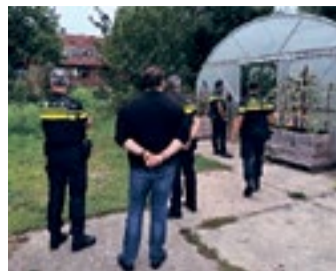
Opbouwwerkers van WIJ Oosterparkwijk en politie Groningen Noord gingen samen op pad.

Wanneer de politie nieuwe collega's in het team krijgt volgen zij in hun eerste weken onder andere de wijkexpeditie. Tijdens de laatste expeditie waren de collega's op pad in de Oosterparkwijk. De opbouwwerkers van WIJO oosterparkwijk lieten hen de wijk zien. Zij bezochten verschillende organisaties, maakten kennis en kregen uitleg over de werkzaamheden van de organisaties. Zo weten ze elkaar direct goed te vinden. Daarnaast zijn de agenten zichtbaar in de wijken aanwezig waardoor je makkelijk met ze in contact kunt komen.