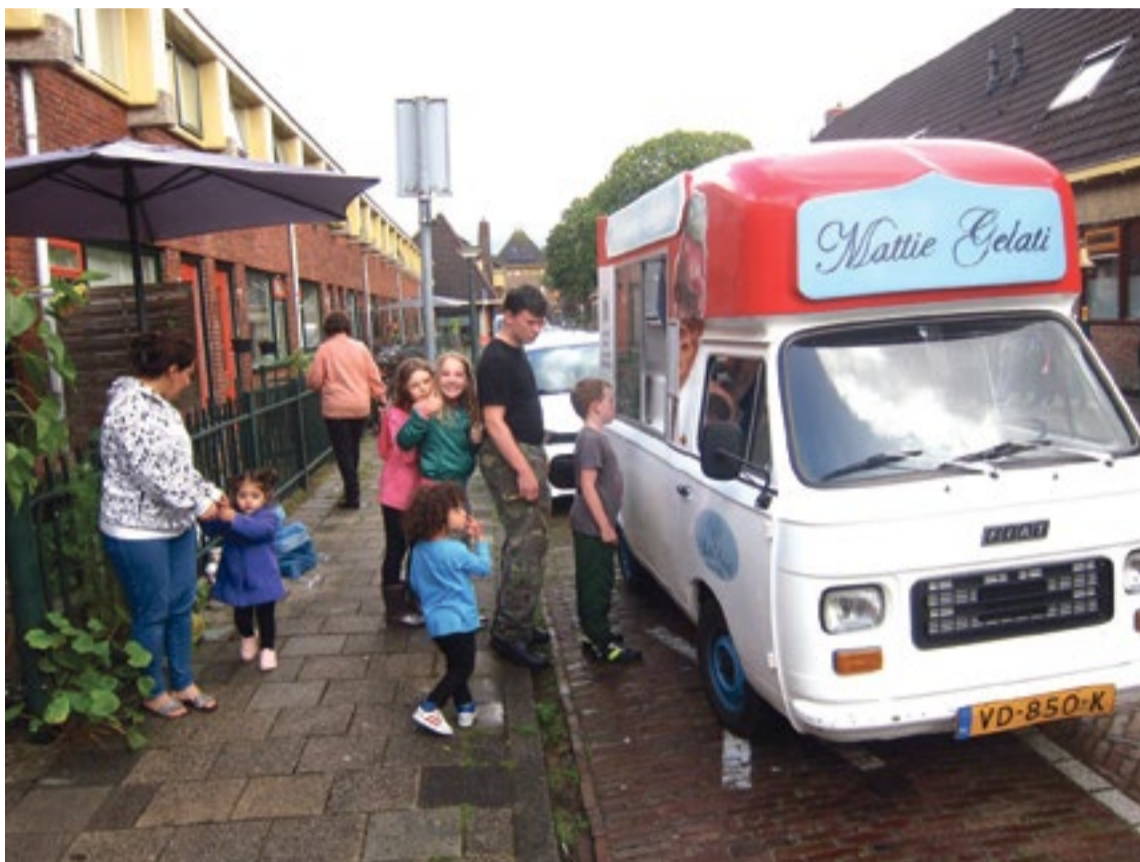
Bewoners in de rij voor Mattie Gelati.

De plantjes zijn gesnoeid en moeten nu eerst wortelen. Volgend voorjaar komen ze tot bloei en geven ze de Goudsbloemstraat een kleurrijk en vrolijk nieuw aanzicht. Het resultaat van een mooi initiatief.