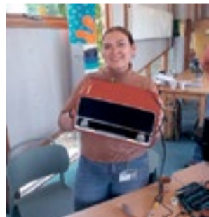
Repaircafe bij Van Houten