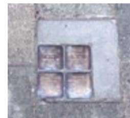
Jan Hissink Janssen straat.