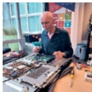
Repaircafe Alfa College

10 oktober waren we aanwezig op het Alfa College om jongeren te laten zien dat repareren vaak mogelijk is. En dat er niets weggegooid hoeft te worden. We hebben leuke gesprekken gevoerd en ook weer aan verbindingen tussen mensen gewerkt.