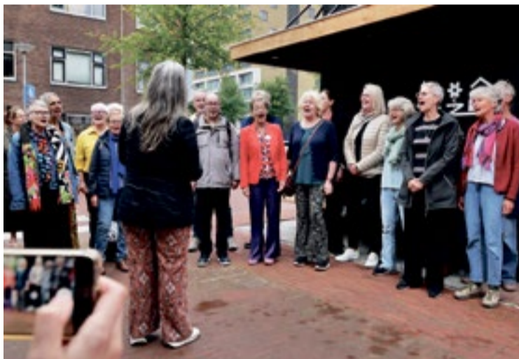
Wijkkoor Eusterpaark zingt het lied 'Michi Noeki'.

Ik ben in de afgelopen weken overdonderd geraakt door het succes van dit nieuwe concept! Zoiets was er nog niet in de wijk, en dat horen we ook van de bezoekers. Het is het meest laagdrempelige wat ik ooit gezien heb, we staan zo'n beetje