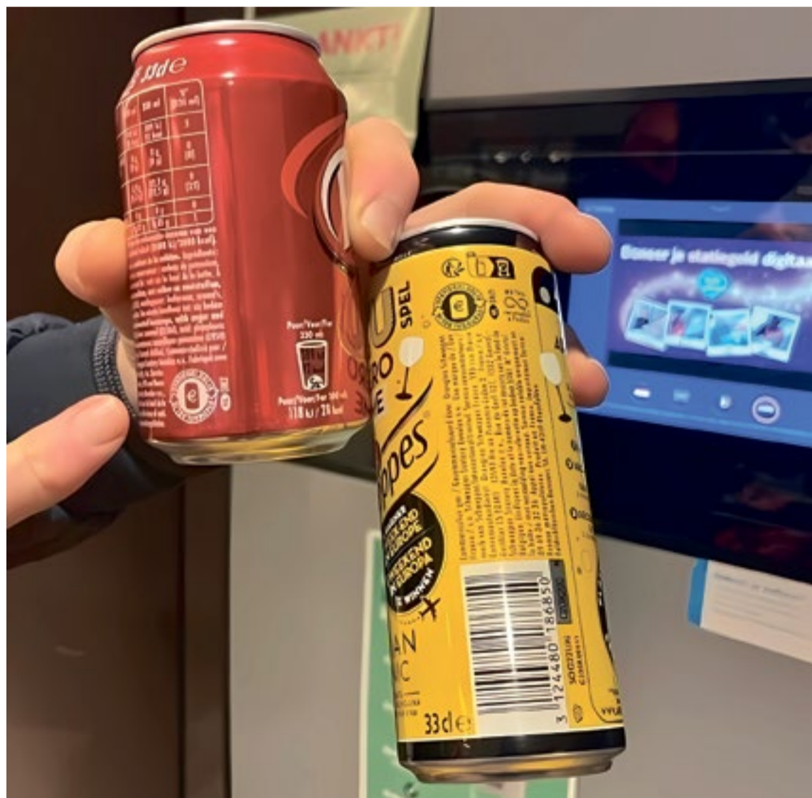
Let erop dat het statiegeldsymbool met het eurotekentje aanwezig is.