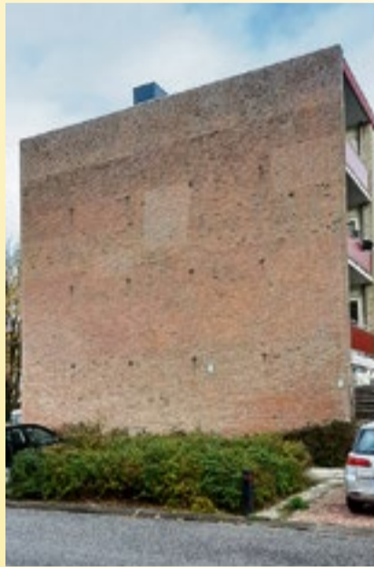
Nu nog saaie kale muur

De wijkraad behandelde verder een aanvraag voor een AED hartstarter of defibrillator bij het TuinPad en een aanvraag voor een busreis, een initiatief van Buurt en Speeltuin Paddepoel in Paddepoel Zuidoost naar de kerstmarkt in Oldenburg. We willen beide aanvragen uit het resterende wijkbudget 2023 laten betalen. Ook stellen we geld beschikbaar voor een initiatief vanuit de wijk om minder goed bedeelde Paddepoelers van een kerstmaal te voorzien. Meer informatie over de wijkraad, de wijkraadsleden en verslagen van onze vergaderingen vindt u op: https://www.paddepoel.info/de-wijkraad