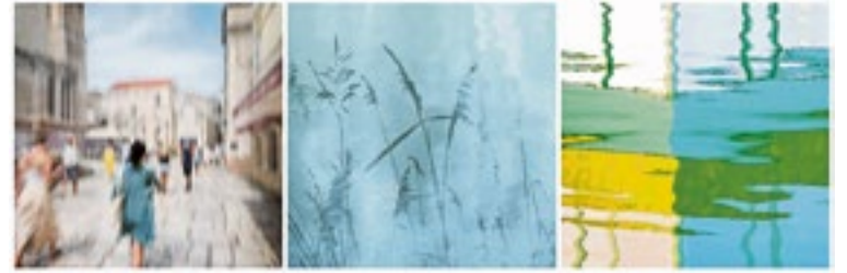
Foto-expositie 3 in 1