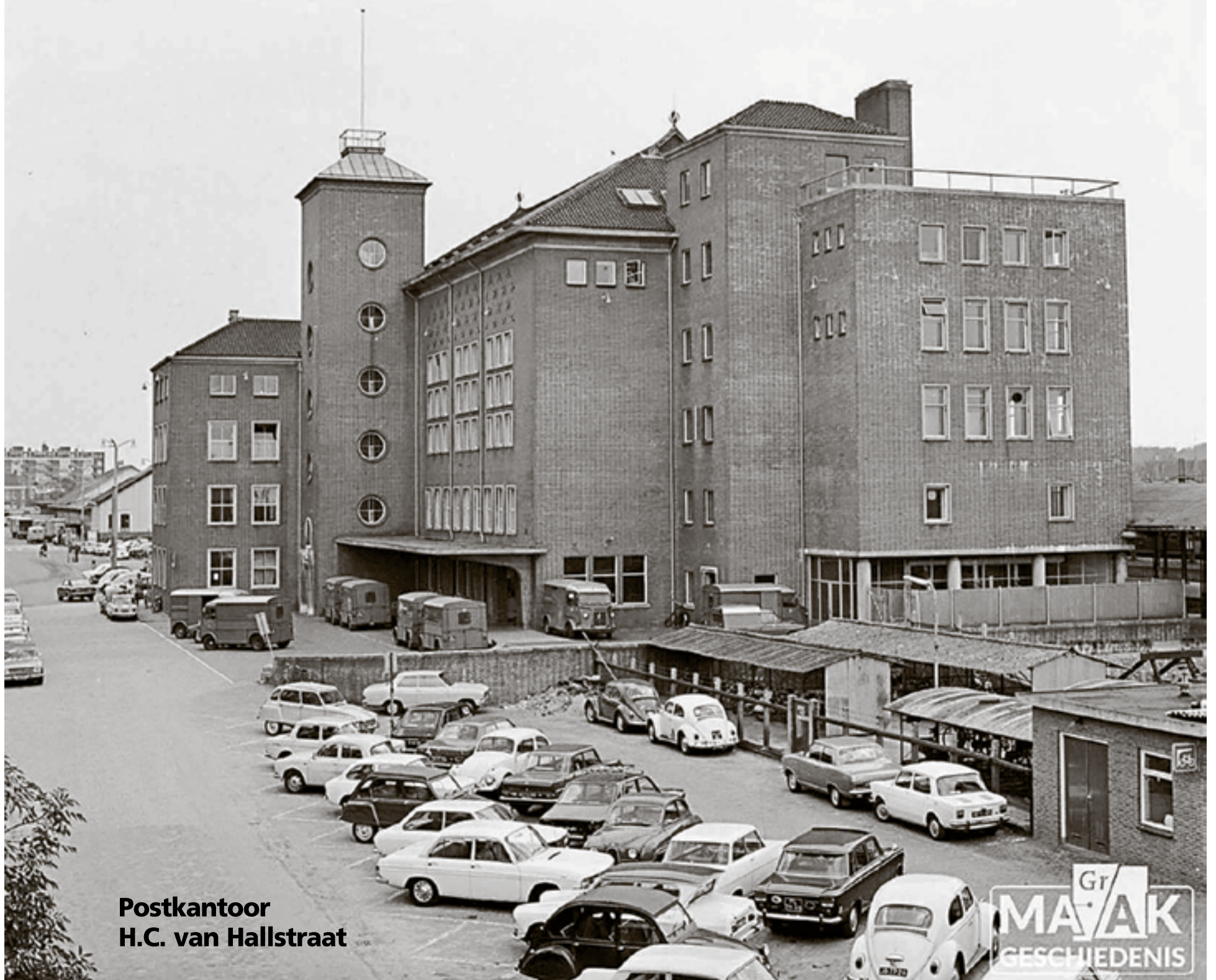
Postkantoor H.C. van Hallstraat