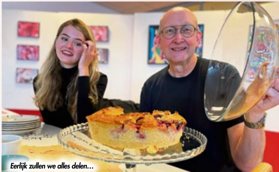
Eerlijk zullen we alles delen...

Kijk voor actueler nieuws na 23 november op onze website: www.wijkpaleispaddepoel.nl