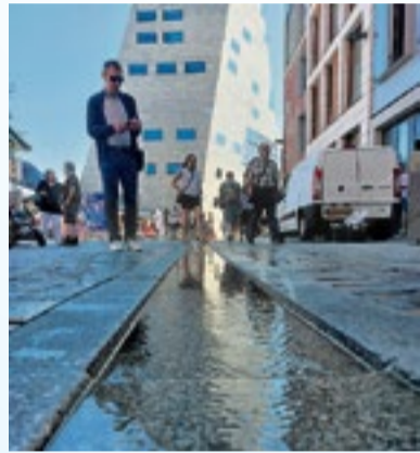
Fotoworkshop De Fontein, thema Forum ZATERDAG 27 januari 2024 10.00 – 12.00 uur De workshop is bestemd voor ieder-