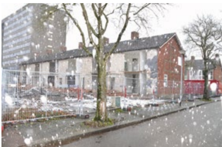
Sloop Lijsterbeslaan in de sneeuw