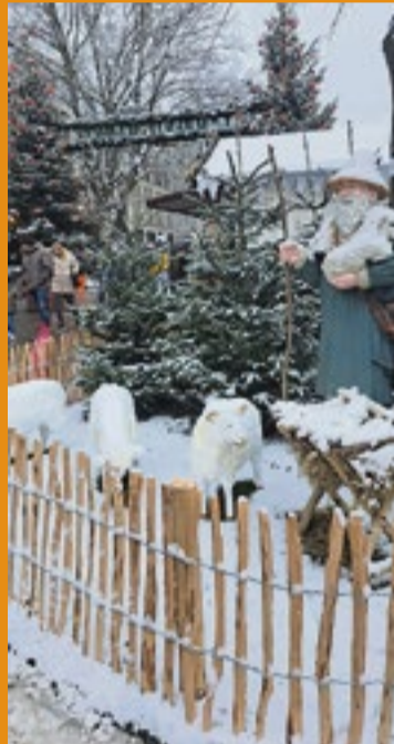
Kerstmarkt in Oldenburg

De wijkraad zoekt nog een voorzitter en/of penningmeester . Die kunnen we voor een goede wijk-oogst goed gebruiken. Ook andere leden nog steeds welkom. Wie heeft er goede wijkvoornemens, een beetje tijd en belangstelling voor de leefbaarheid in de directe omgeving? Mail voor een vrijblijvend kennismakings- en informatiegesprek. Zie voor meer informatie Paddepoel.info/wijkraad .