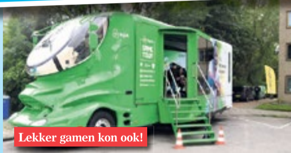
Lekker gamen kon ook!