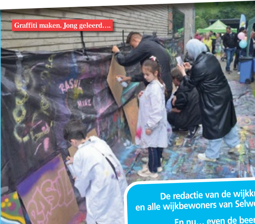
Graffiti maken. Jong geleerd....

Op 25 mei was het zover! Het 60 jarig jubileumfeest werd gevierd. Het was erg gezellig. Het programma was zeer gevarieerd en het publiek enthousiast. We konden nog net wat foto's meepikken in deze krant, zodat degenen die er waren nog even na kunnen genieten. En wie er niet was: geniet nog even mee! Fotografie: Hans Mulder. (Tenzij anders vermeld).