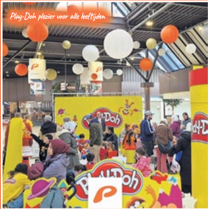
Play-Doh plezier voor alle leeftijden