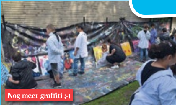
Nog meer graffiti ;-)

De redactie van de wijkkrant feliciteert het Wijkplatform en alle wijkbewoners van Selwerd met dit prachtige succesvolle feest. En nu... even de beentjes omhoog op de bank en dan maar weer op naar het 75-jarig bestaan!