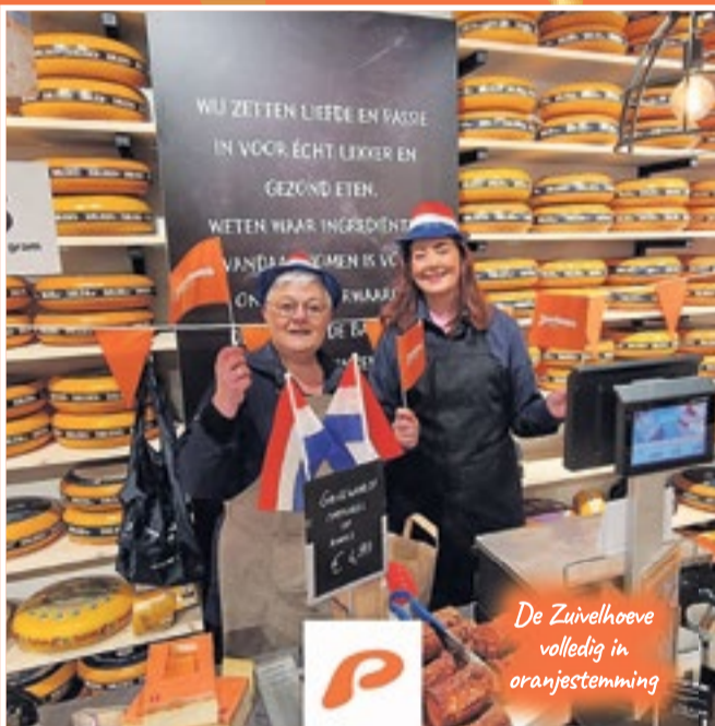
De Zuivelhoeve volledig in oranjestemming