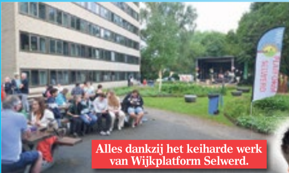
Alles dankzij het keiharde werk van Wijkplatform Selwerd.