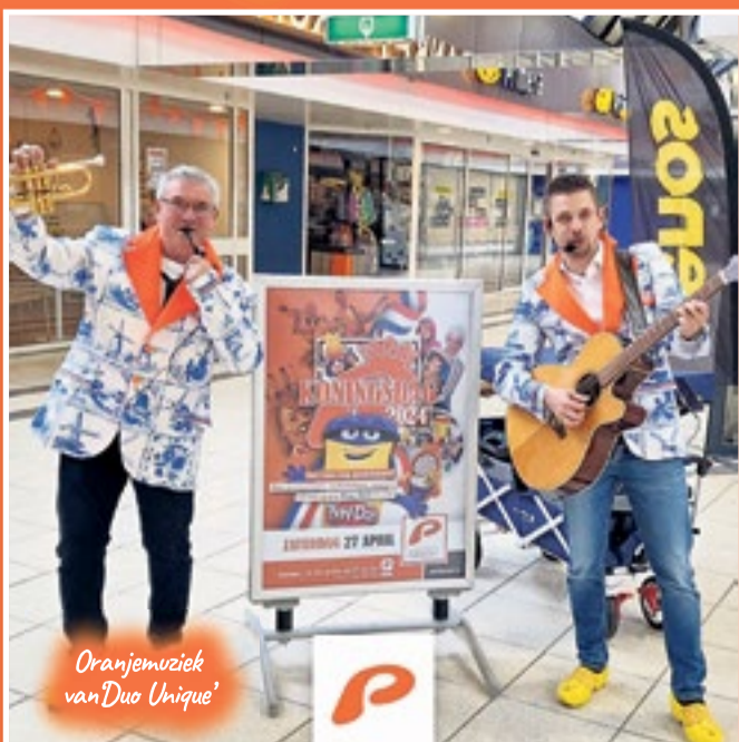
Oranjemuziek van Duo Unique