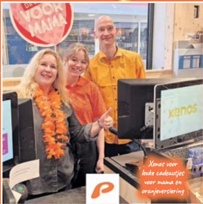
Xenos voor leuke cadeautjes voor mama en oranjeviersiering