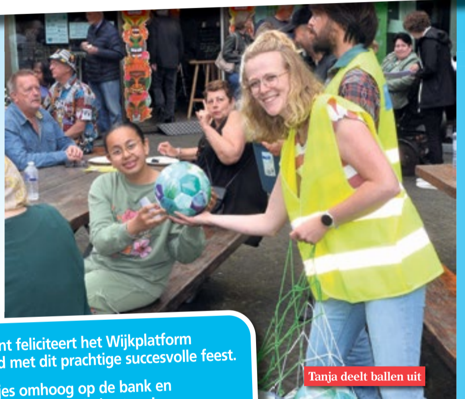
Tanja deelt ballen uit

De redactie van de wijkkrant feliciteert het Wijkplatform en alle wijkbewoners van Selwerd met dit prachtige succesvolle feest. En nu... even de beentjes omhoog op de bank en dan maar weer op naar het 75-jarig bestaan!