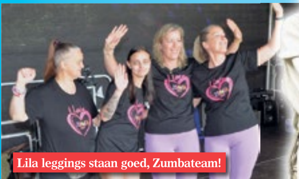
Lila leggings staan goed, Zumbateam!