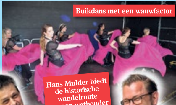
Buikdans met een wauwfactor