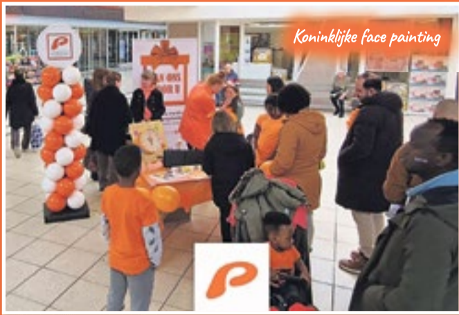
Koninklijke face painting