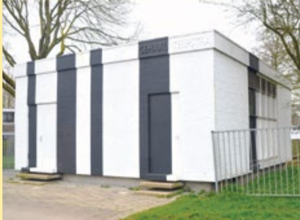
Het rioolgemaal aan de Kastanjelaan 1 in Selwerd.

We gaan deze keer terug naar het jaar 1971, toen onze wijken Selwerd en De Paddepoel nog volop in ontwikkeling waren. Het was natuurlijk een probleem om voor alle plannen, die uitgevoerd dienden te worden, genoeg financiën bijeen te krijgen. Een van de financiële bronnen was de provincie Groningen en de gemeente was afhankelijk van de besluitvorming van Gedeputeerde Staten.