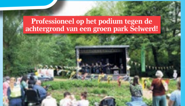
Professioneel op het podium tegen de achtergrond van een groen park Selwerd!