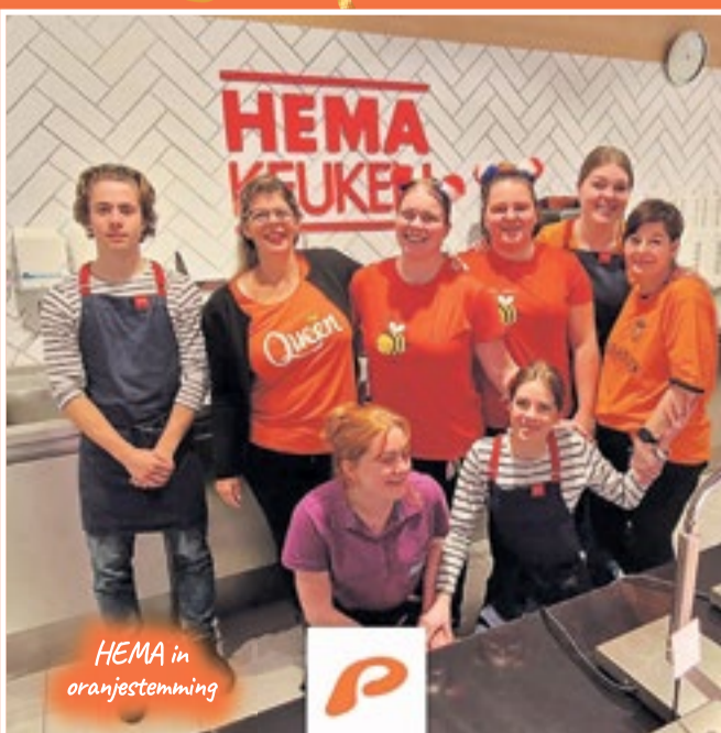
HEMA in oranjestemming