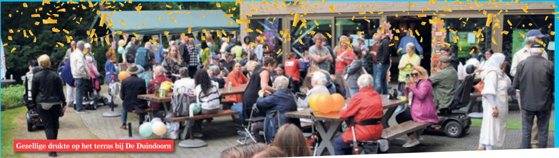
Gezellige drukte op het terras bij De Duindoorn