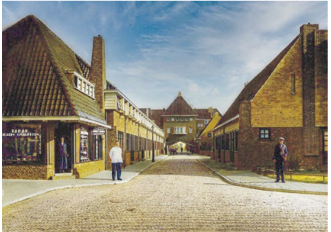
Foto: P.B. Kramer, Groninger Archieven. Ingekleurd door Wil de Boer

Aangezien kappers vaak wit droegen, is het aannemelijk dat de man op de stoep de eigenaar is. In de deuropening staat een vrouw met jurk en schort - waarschijnlijk zijn echtgenote. Het was gebruikelijk dat de man