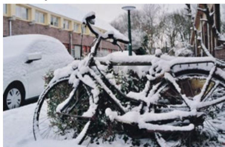
Verse sneeuw in de Begoniastraat (waar is het zadel?)