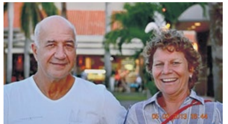
Flora met Wubbo Ockels.

Meer informatie over Flora en Arieaan de Bie is te vinden op hun website: floraenarieaan.nl