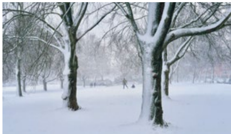
Sleetje rijden in het Pioenpark.