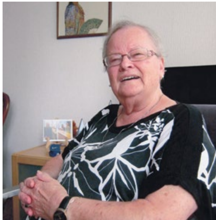
Dit interview is eerder verschenen in de Wijkkrant Oosterpark van september 2016.