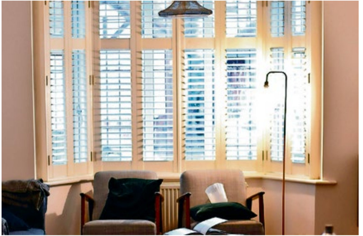
■ Raambekleding in de vorm van shutters wint aan populariteit.

Met de juiste aanpak en wat geduld blijken veel vlekken minder definitief dan ze op het