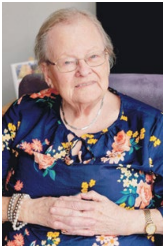
Uit 'Verrassende vrouwen van de Oosterpark' - Tien portretten, 2021. Door Marianne Kootstra, foto's: Frans Geubel