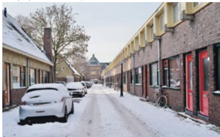
Auto's en wegen bedolven onder de sneeuw in de Zonnebloemstraat.