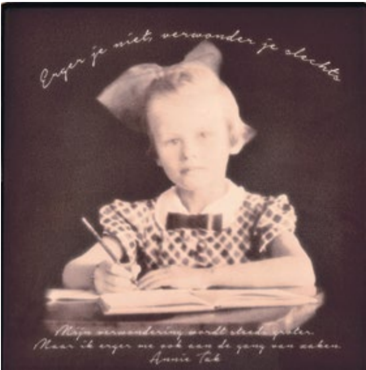
In het blad van de ontmoetingstafel op het Annie Tak Belevingsveld is op een jeugdfoto de volgende tekst aangebracht: 'Erger je niet, verwonder je slechts. Mijn verwondering wordt steeds groter, maar ik erger me ook aan de gang van zaken.'