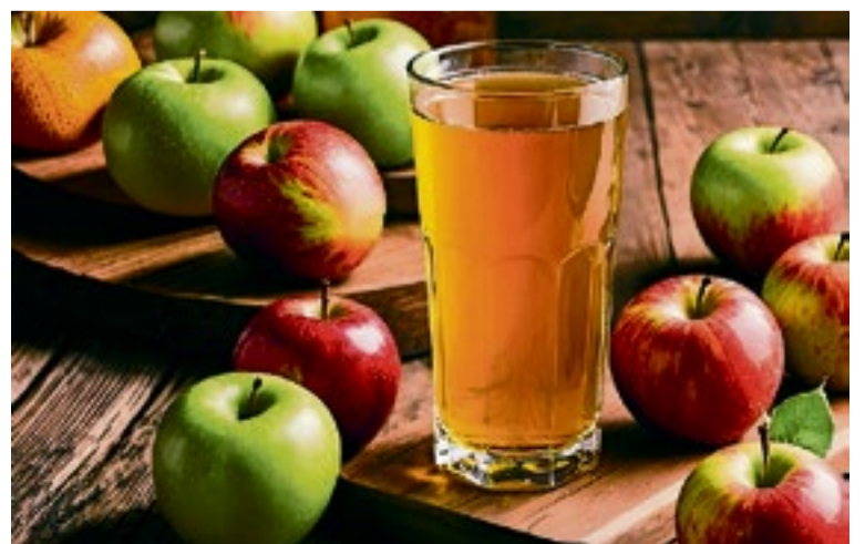
■ Vruchtensap bevat vaak onverwacht veel suiker. Er zijn gezondere alternatieven.

De algemene boodschap is duidelijk: kinderen moeten vooral