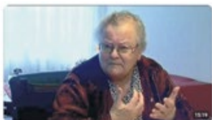
'Annie Tak Fonds' van OOG Groningen